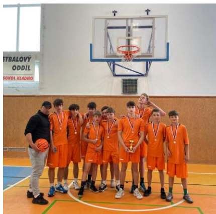
Pokračování z předchozí strany