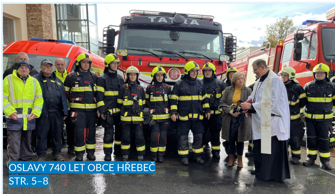
OSLAVY 740 LET OBCE HŘEBEČ STR. 5-8