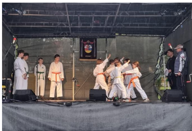
Vystoupení dětí MŠ Valentýnka, souboru Hříbátka a ukázka Karate Tygr Klubu na Dni obce