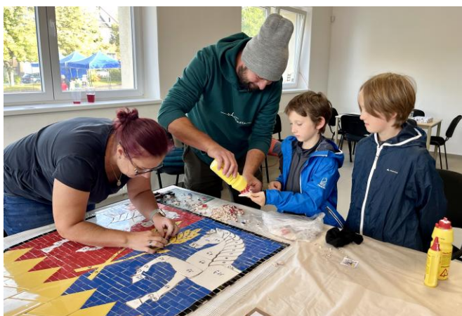
Společné tvoření mozaikového znaku obce při oslavách Dne obce