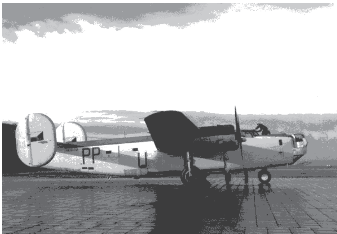
Letoun Consolidated B-24 Liberator, který měla ve výzbroji 311. squadrona během své služby u Coastal Command.