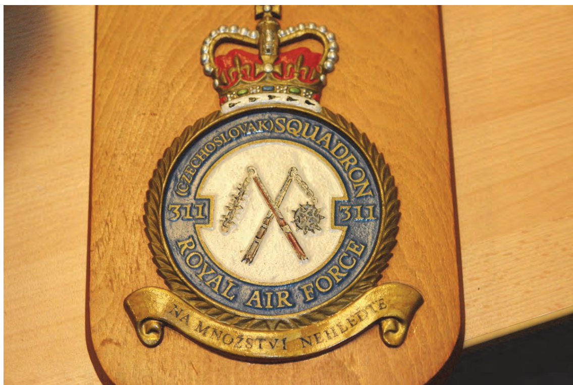
Oficiální znak 311. československé bombardovací perutě s mottem: "Na množství nehleďte" ("Never regard their numbers").